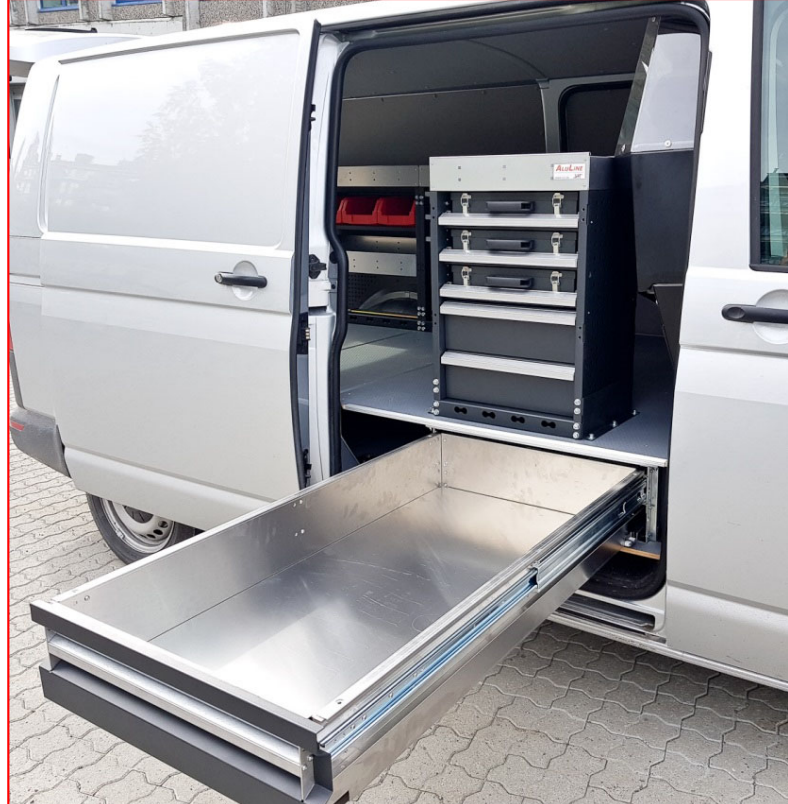
ALULINE UGS type B1 i skyvedør i VW Transporter