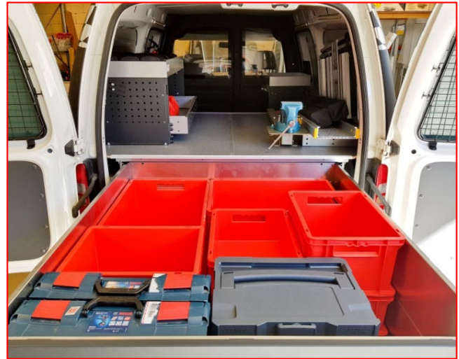
UGS A1 m/kasser.