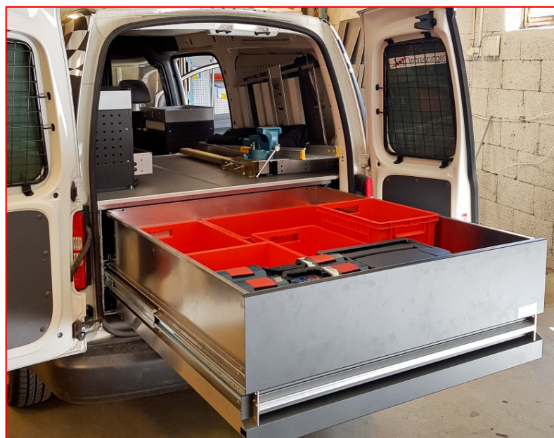
ALULINE UGS type A2 bakover i VW Caddy Maxi (bilde over) - og vanlig gulvhøyde mellom skyvedørene (bilde til venstre). Gir god takhøyde og plass til mye utstyr mellom skyvedørene. Kan evt kombineres med AluLine reoler.