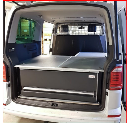
ALULINE UGS type A2 i Caravelle