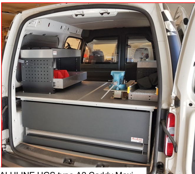
ALULINE UGS type A2 Caddy Maxi m/AluLine hyller oppå oppbygd gulv.

UGS Type B og C (høy og lav) leveres også i kort utgave med utvendig lengde på 667mm (innv. 585mm).