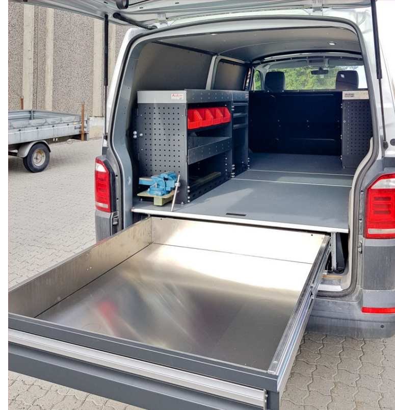
ALULINE UGS type A1 bakover i VW Transporter