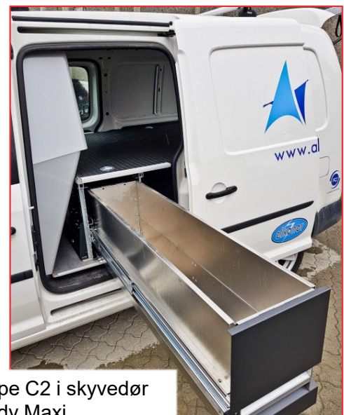
UGS type C2 i skyvedør på Caddy Maxi.