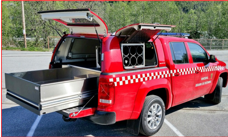
ALULINE UGS type A2 i VW Amarok pickup

Aluline undergulvskuffer leveres i seks forskjellige størrelser for å dekke alle behov. Skuffene er testet for en jevn belastning på 200 kg og er produsert i aluminium, slik at du får utnyttet nyttelasten i bilen din til verktøy og varer. Skuffene har fullt uttrekk og kan tilpasses i alle biler. Vi leverer komplette løsninger med dobbeltgolv og festebreketter – evt også med reoler etc oppå oppbygd gulv.